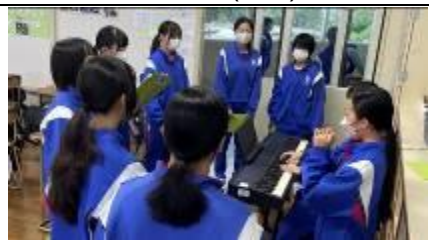
4 Kumi (Alto)