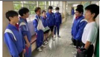
3 Kumi (Parte dos homens)