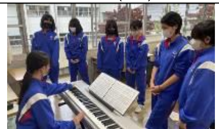
2 Kumi (Alto)