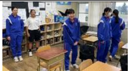
3 Kumi (Alto)