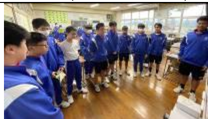
4 Kumi (Parte dos homens)