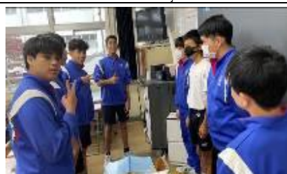
1 Kumi (Parte dos homens)