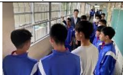
2 Kumi (Parte dos homens)