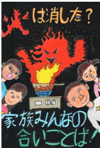
5º ano-Colocação: Prata ( Gin )