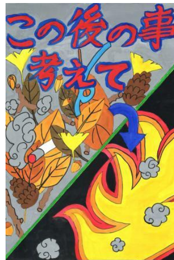
6º ano-Colocação: Prata ( Gin )